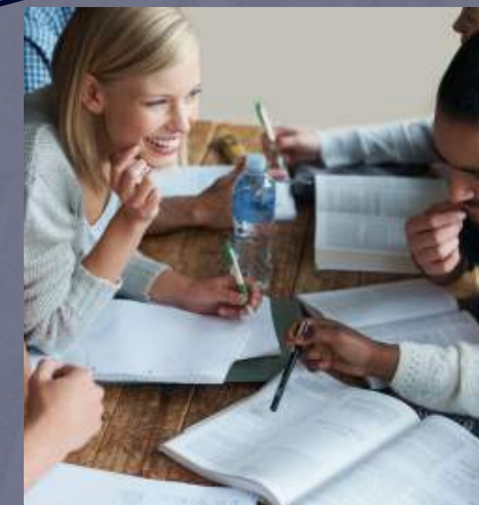
TEST Y ESCALAS ACERCAMIENTO