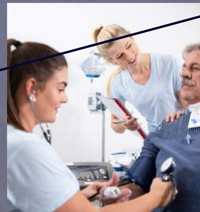
PRUEBAS DIAGNÓSTICOS IN SITU