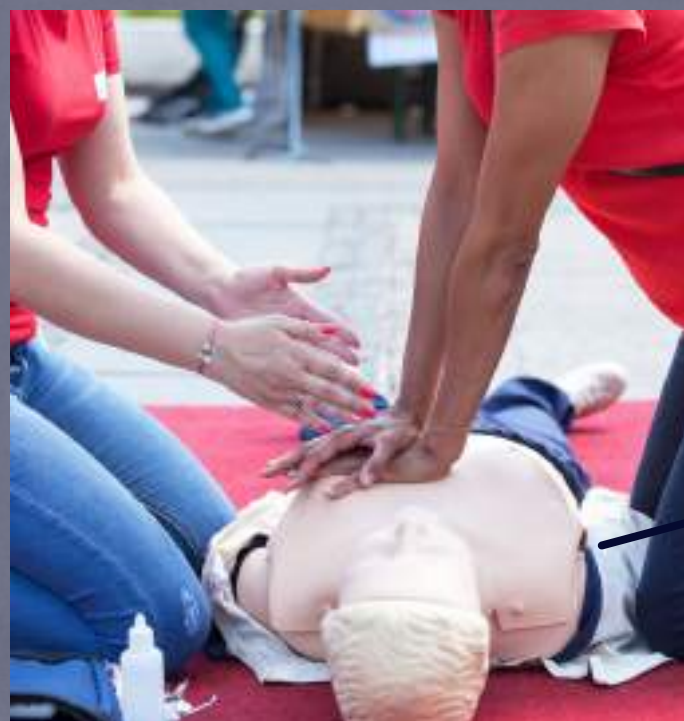
CHARLAS - TALLERES INFORMACIÓN Y FORMACIÓN

Reparto de marcapáginas con la incorporación de códigos QR con información detallada sobre la charla/taller