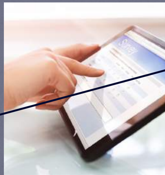
ENCUESTAS ENFERMERAS Y GENERALES